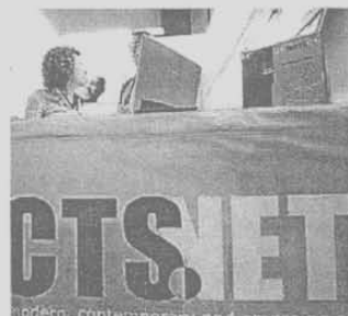
Stand de Artfacts.net