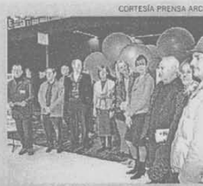
Entrega de los premios ARCO/BEEP